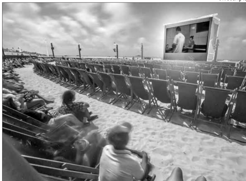
As inscrições são gratuitas no site do evento até 25 de agosto