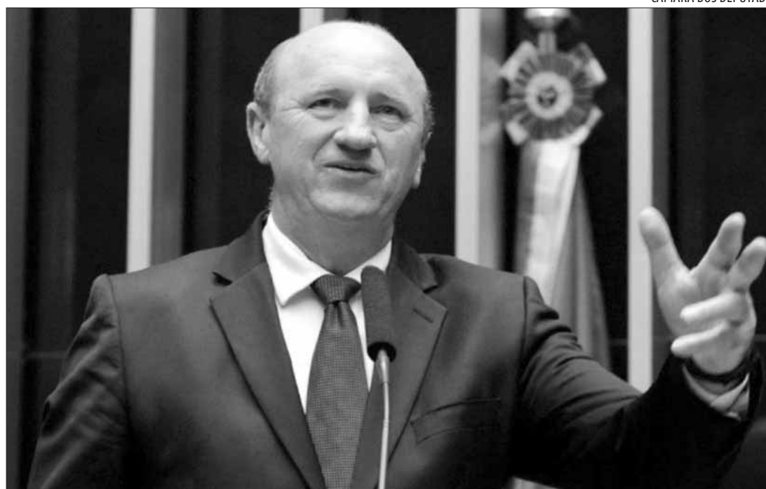
Neri Geller declarou que o Ministério da Agricultura tinha informação sobre arroz colhido no RS

«VERSÃO» Ex-secretário afirma que o certame foi mal organizado pelo Ministério da Agricultura, culpa o ministro Fávaro e diz que não pediu demissão